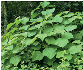
Blauglockenbaum Paulownia tomentosa Wurzeln, Blüten und Samen