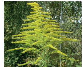
Amerik. Goldruten Solidago canadensis, S. gigantea Ganze Pflanze