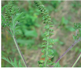
Ambrosia Ambrosia artemisiifolia Ganze Pflanze