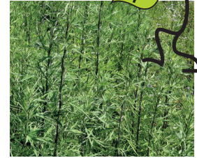
Verlotscher Beifuss Artemisia verlotiorum Ganze Pflanze