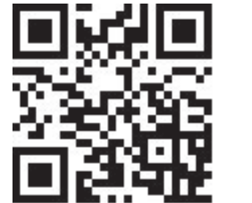
Weitere Pflanzen und Informationen

Wo Sie den Neophytensack kostenlos beziehen und wo Sie ihn entsorgen können, entnehmen Sie bitte dem Abfallkalender Ihrer Gemeinde. Grössere Mengen an Ast- und Wurzelmaterial können direkt bei der KVA Thurgau oder beim ZAB angeliefert werden.