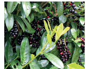
Kirschlorbeer Prunus laurocerasus Früchte und Wurzeln