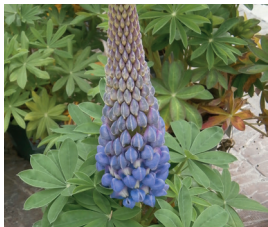
Vielblättrige Lupine Lupinus polyphyllus Ganze Pflanze