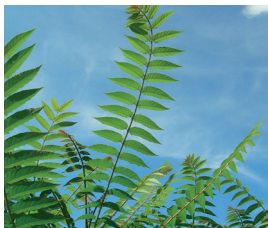
Götterbaum Ailanthus altissima Wurzeln, Blüten und Samen