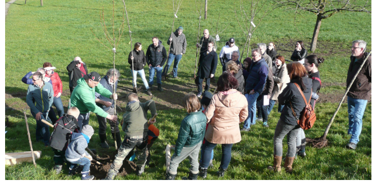
Pflanzaktion im Göttibaum-Obstgarten des VP Höfe

Verschiedene Vögel- und Fledermausarten brüten in Höhlen und Nischen. Solche Strukturen sind jedoch immer weniger vorhanden. Zur Förderung dieser Tiere können stattdessen art-spezifische Nistkästen aufgehängt werden. Im Rahmen des Weihnachts-Artenförderprojekts können Patenschaften für diese Nistkästen übernommen werden. Als Dank werden die Nistkästen mit dem Namen der Patin/des Paten beschriftet. Im Folgejahr werden die Nistkästen geprüft und die Paten über den Nisterfolg informiert.