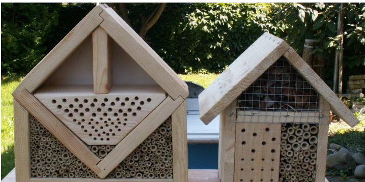
Selbst gebastelte Wildbienen-Nisthilfen

Dank der Übernahme einer Patenschaft kann dem Rückgang entgegengewirkt werden. Mit einem einmaligen Beitrag können Patinnen/Paten die gewünschte Hochstamm-Obstbaumsorte wählen und in den folgenden zehn Jahren die Früchte des Baumes für den Eigengebrauch ernten.