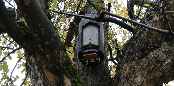
Nistkästen für das Braune Langohr im Rahmen des VP Muolen

Im Jahr 2018 wurden in Muolen 100 Nistkästen für das Braune Langohr verkauft - ein toller Erfolg.